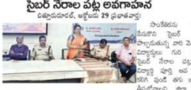
సైబర్ నేరాలపై అవగాహన కార్యక్రమం

సైబర్ నేరాలపై అవగాహన కలిగించే ఉద్దేశ్యంతో సైబర్ నేరాలపై అవగాహన కార్యక్రమం నిర్వహించారు.