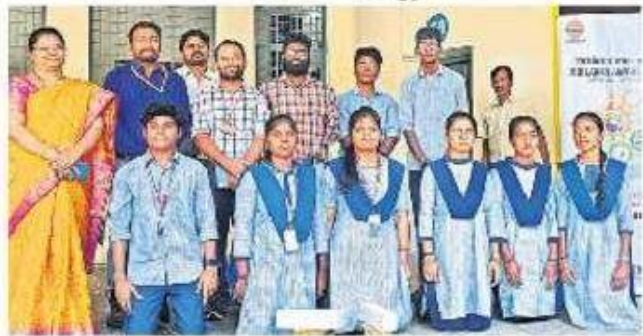
విజేతలైన విద్యార్థులతో నిర్వాహకులు