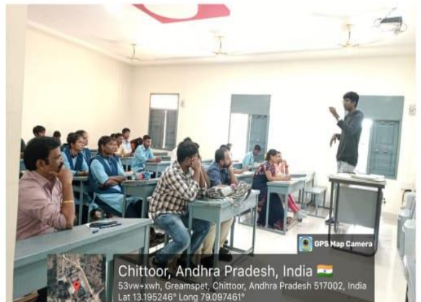
Chittoor, Andhra Pradesh, India 53vw-xwh, Greampet, Chittoor, Andhra Pradesh 517002, India Lat 13.195246° Long 79.097461°