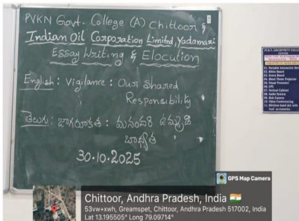
Chittoor, Andhra Pradesh, India 53vw-xwh, Greampet, Chittoor, Andhra Pradesh 517002, India Lat 13.195505° Long 79.09714°