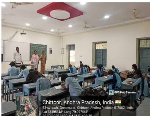
Chittoor, Andhra Pradesh, India 53vw-xwh, Greampet, Chittoor, Andhra Pradesh 517002, India Lat 13.195148° Long 79.097441°