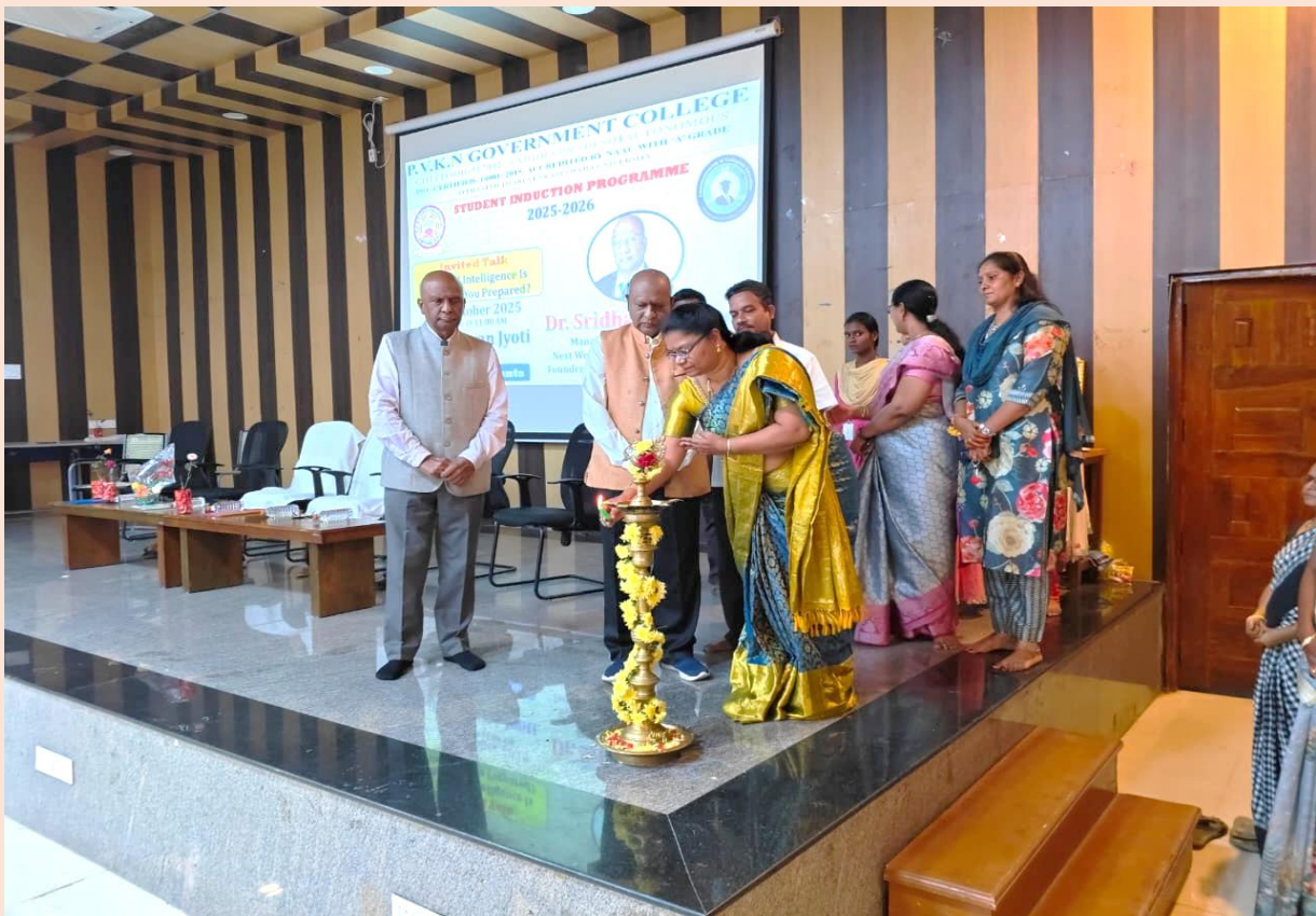
(Lightening of the lamp by Dignitaries in the inaugural session of SIP)