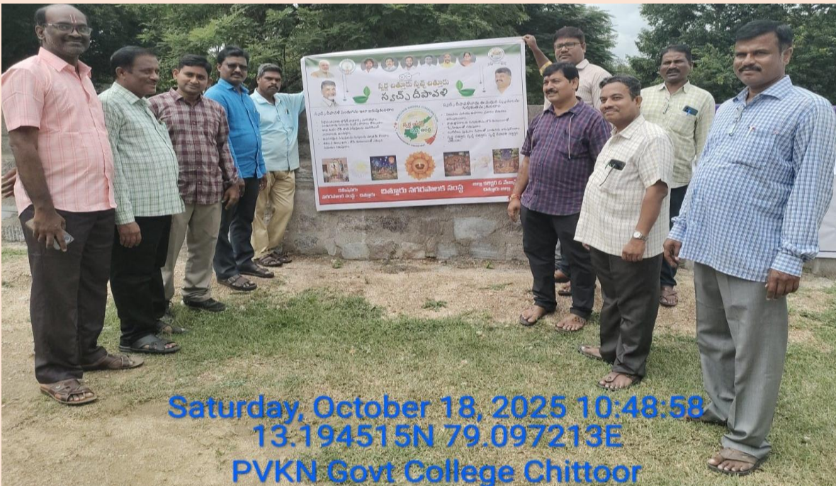
(B.Sc Students and staff of the college participating in the Swachh Diwali Awareness Rally)