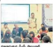
సైబర్ నేరాలపై అవగాహన కార్యక్రమం

సైబర్ నేరాలపై అవగాహన కలిగించే ఉద్దేశ్యంతో సైబర్ నేరాలపై అవగాహన కార్యక్రమం నిర్వహించారు. ఈ కార్యక్రమంలో సైబర్ నేరాలపై అవగాహన కలిగించే ఉద్దేశ్యంతో సైబర్ నేరాలపై అవగాహన కార్యక్రమం నిర్వహించారు.